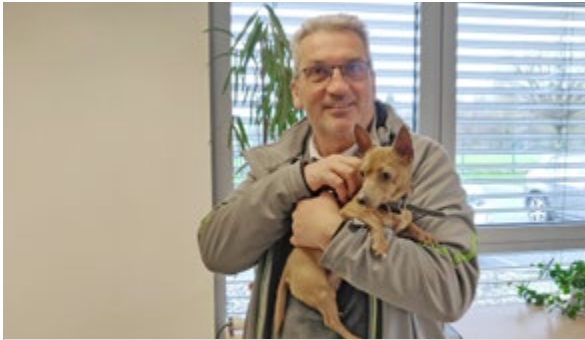
La commune reste mobilisée pour aider les animaux perdus à retrouver leur foyer.