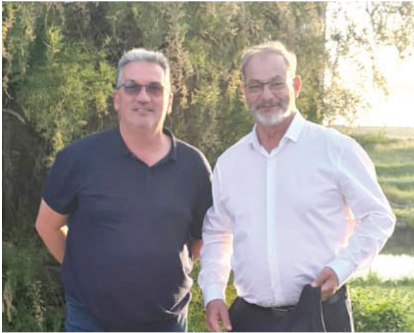
Avec Vincent BARRAUD, maire d'Étaules