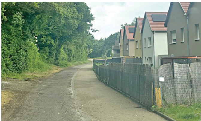
Aménagement du stationnement rues Noblat et Mittelweg

Quelques travaux ont été réalisés en mai dans les rues du Canal, de Habsheim, de Lencouacq, Noblat et Mittelweg.