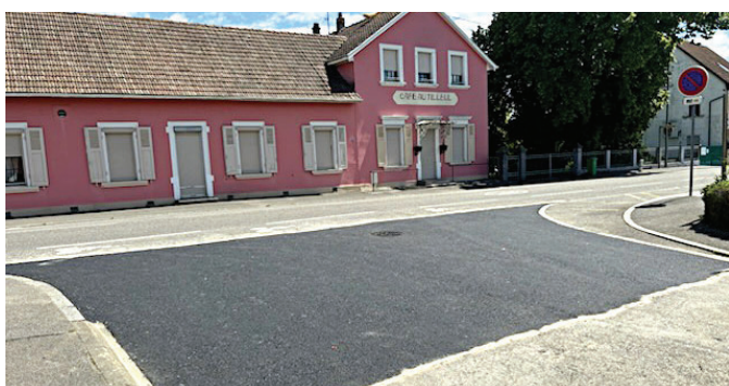
Reprise de l'affaissement à l'entrée rue du Lencouacq