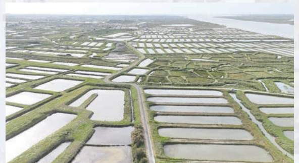
Marais salants - Étaules